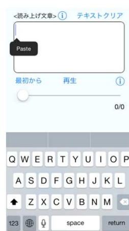
⑥ テキスト読上 再生