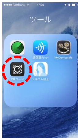
① QRコードリーダー起動