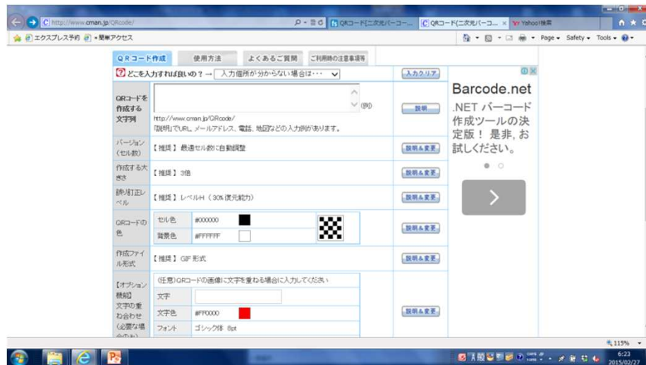
QRコード作成サイト

作成サイト http://www.cman.jp/QRcode/ を利用 TextReader