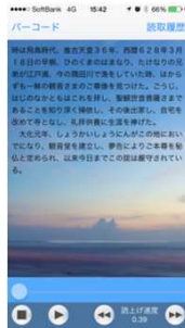
端末アプリケーション TextReader